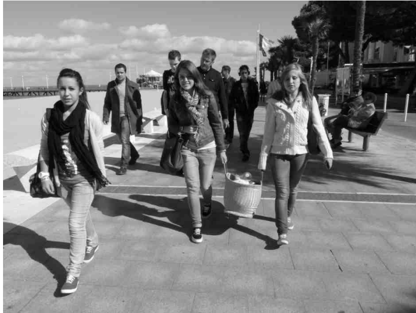
Petite balade pour digérer le délicieux pique-nique.