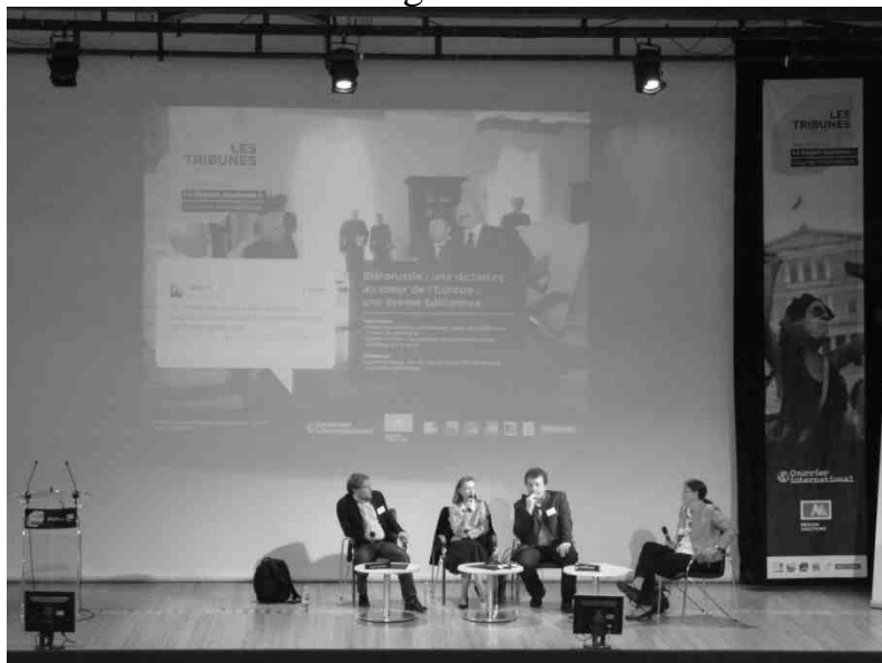
L'interaction avec le public : les intervenants répondent aux questions qui leur arrivent, via Twitter ou dans la salle.