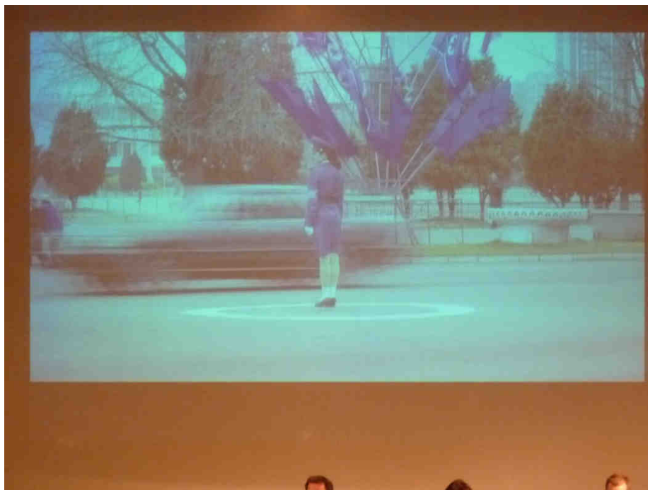
Photographie représentant l'une des rares policières Nord-Coréenne.