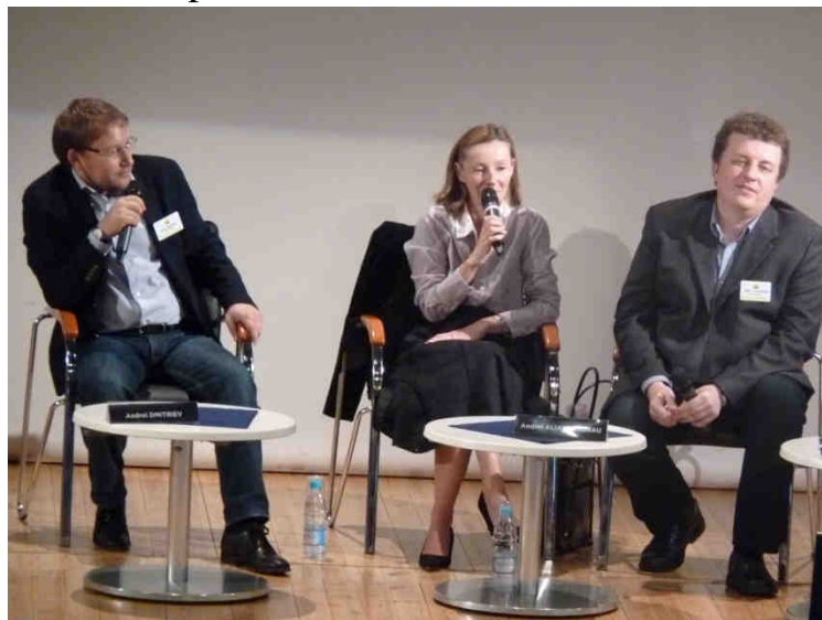
Les intervenants expliquant leur histoire dans leur pays : la Biélorussie.