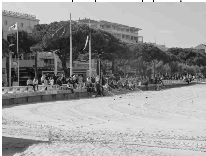
Vue d'ensemble sur les Première ES et L.