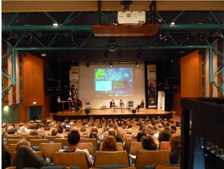
Les nombreuses personnes ayant assisté à cette conférence.