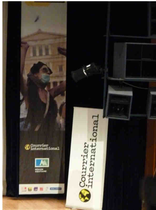
Affiche présente dans la salle de conférence.