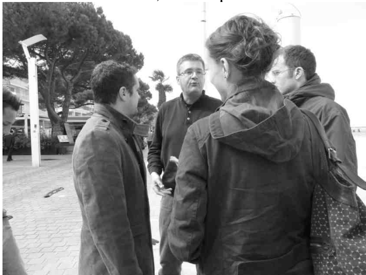
Débriefing entre professeurs après cette journée très instructive.