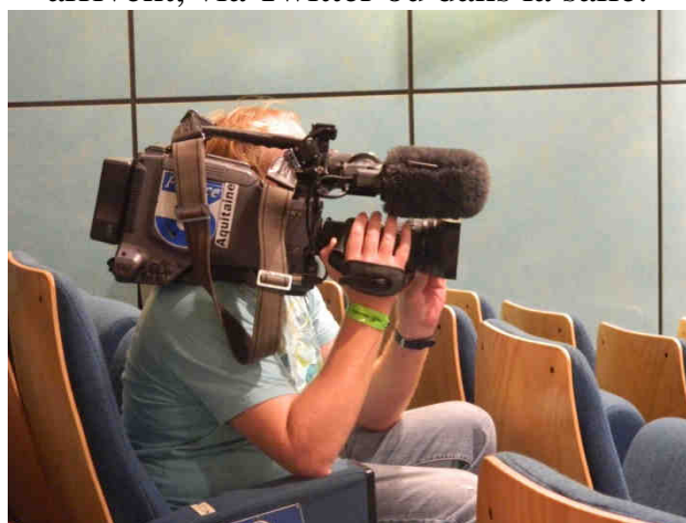
Lors de la conférence, un journaliste reporter de France 3 Aquitaine était présent.