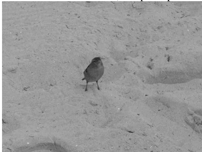
Un invité surprise pendant le pique-nique.