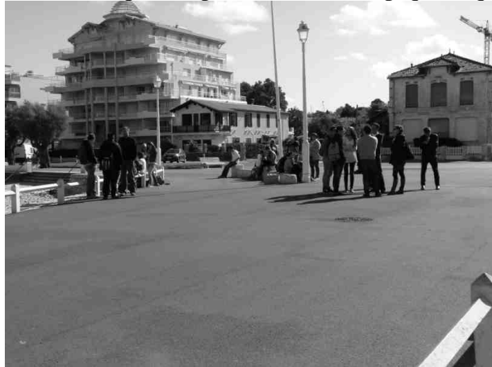
Arrivés au bout de la balade, nous repartons en direction du bus.